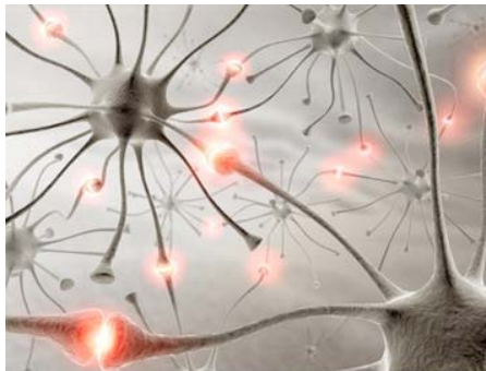
Dem Freiburger Verfahren zur Datenauswertung liegt die Elektroenzephalographie (EEG) zu Grunde

Bisher gab es schon einige Ansätze, mit Hilfe von mathematischen Algorithmen die Auswertung des EEG zu automatisieren. Nicht jedes Verfahren aber eignet sich für jede Form von Anfällen. Um eine optimale Erfassung aller Anfallstypen zu gewährleisten, nutzten die Wissenschaftler um Meier daher verschiedene mathematische Auswertungsverfahren parallel. "Unsere Methode bedarf keiner individuellen Anpassung, darüberhinaus eignet sie sich für alle Anfallstypen", erklärt Meier. An etwa 1400 Stunden Langzeit-EEG mit insgesamt 91 verifizierten Anfällen wendeten Meier und seine Kollegen das Verfahren an um seine Leistungsfähigkeit zu überprüfen.